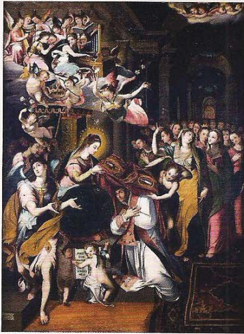
Leonardo Jaramillo. Imposición de la casulla a San Ildefonso , 1636. Óleo sobre tela. Col. Museo del Convento de los Descalzos, Lima, Perú.