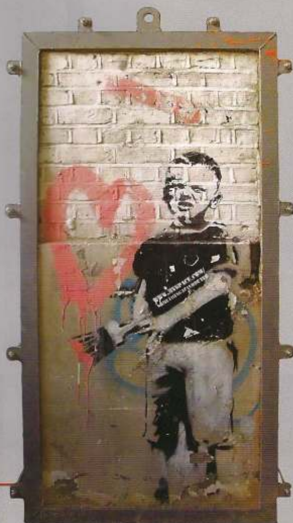
Painter Rat, arriba. Spray sobre puerta de acero, 2004. Papa'rat'zi rat, arriba al centro. Spray sobre yeso, 2005. Microphone rat with heart, arriba a la derecha. Spray sobre yeso, 2004. Graffiti boy, a la derecha. Spray sobre tabique, 2006. Página opuesta: Tough now, arriba a la izquierda. Spray sobre yeso. Composition wall, arriba a la derecha. Spray sobre yeso, 2004. Artist rat, abajo. Sprays sobre triplay, 2004.