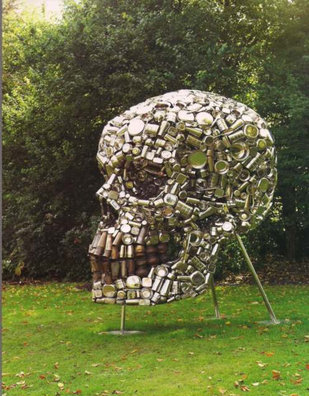
"Mindshotdown," 2008, arriba a la derecha. Acero inoxidable con utensilios viejos, 240 x 150 x 205 cms. "Everyday" (Detalle), 2009, a la derecha. Acero inoxidable, utensilios. Diámetro 213.3cms. Foto: Mike Bruce. "Et Tu, Duchamp?" (Detalle) 2009, abajo. Bronce, 114 x 88 x 59 cms, más la tibia de mármol 123 x 123 x 122 cm. Foto: Mike Bruce.