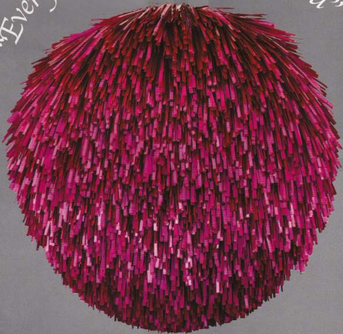
“Sin título,” 2008. Estructura de acero, plástico pintado, con pinzas de acero inoxidable. Edición de 3. 230 x 220 x 60 cm.

“Mind shot down” “Et tu Duchamp?” “Everyday” “Very Hungry God,”