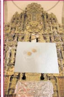
El pan de cada día: los personajes crean momentos dentro de la iglesia.