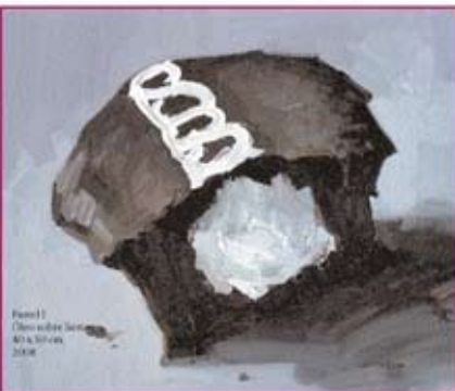
Panel 1 Obras de Jorge Luis Borges ATA Solano 2008

El entusiasmo participó en esta experiencia interdisciplinaria que plantea la relación entre el arte contemporáneo y el sentimiento religioso. El desarrollo apenas inicia, como en esos breves pero terribles relatos de Borges, todas las coincidencias, las circunstancias y las personas han quedado en lugares propios para una puesta en escena que nadie prevé al inicio de los tiempos, pero que todos experimentan con ansiedad.