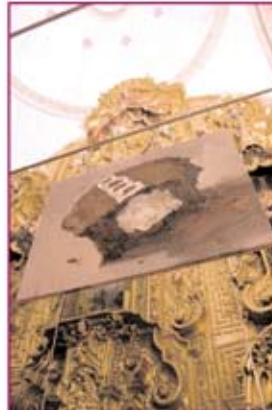
El nuevo paisaje reflexiona sobre la historia de la sagrada.