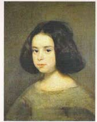
Una niña de Velázquez, arriba. "La Duquesa de Alba" de Francisco Goya, a la izquierda. Grupo de visitantes durante la exposición de Sorolla de 1909, abajo a la izquierda.

propio del final del Siglo XIX, con suntuosos paneles de madera, en una atmósfera ornamental, recargada, muy española, intacta hasta entonces.