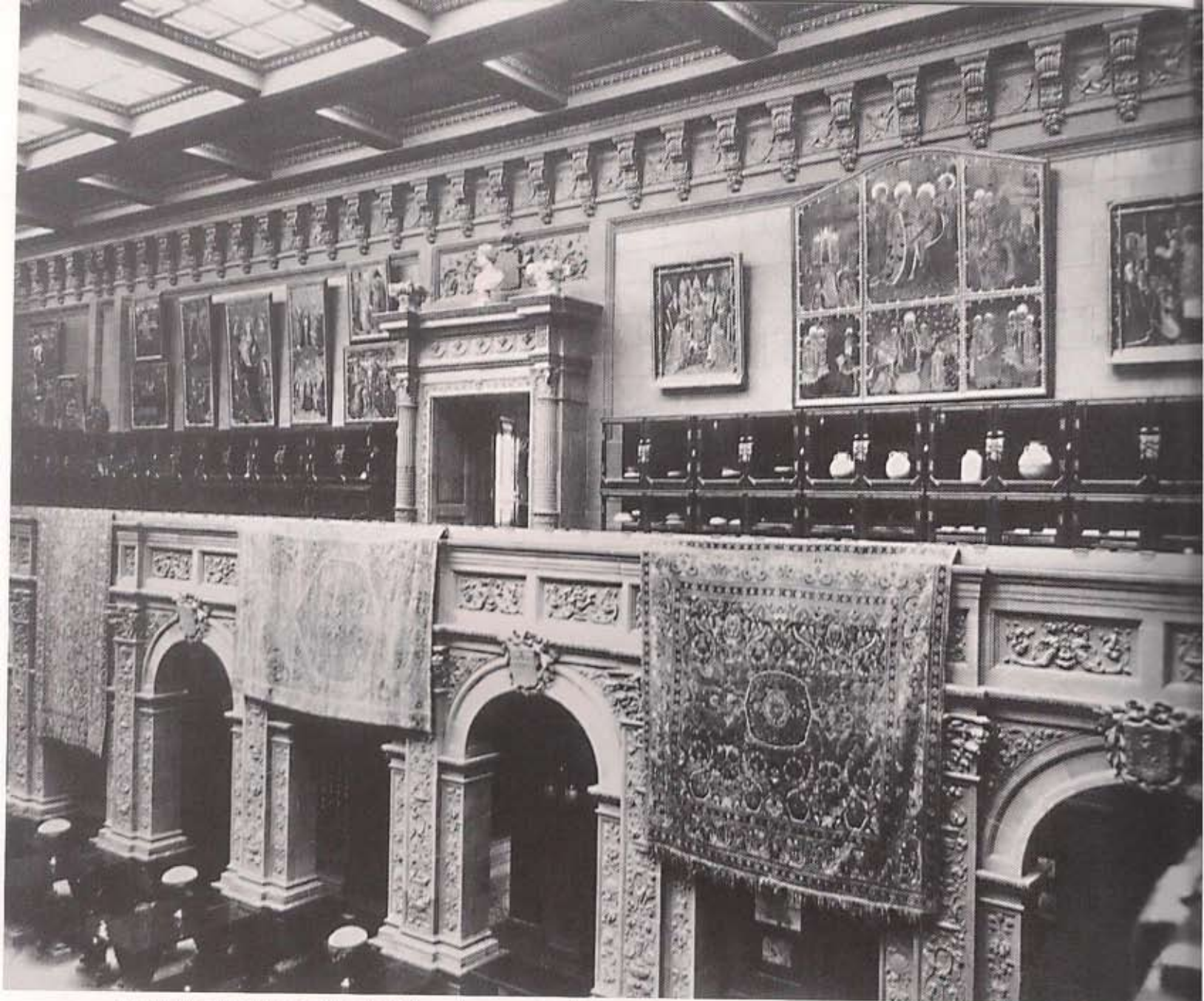
El patio central en la época de su fundador, arriba, con la museografía original, tapetes colgantes, selección personal de pinturas como lo vemos en el díptico que sobrepasa la cornisa.

dos, Galicia y la romería, Aragón y su jota, Navarra y su gravedad, Alicante, Andalucía, Castilla. Cada uno su luz, su color, su ambiente.