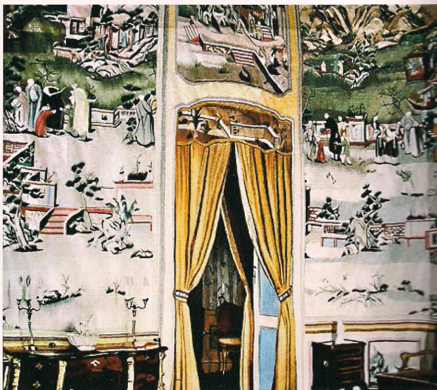
Fernando Palomar, Petrolero , 2008, arriba. Tapiz alto liso, 100% lana. Tejido y teñido a mano con anilinas minerales. 285 x 263 cm. Tapiz con tapiz chino, 2007, arriba a la derecha, (gobelino Fernando Palomar 01 web). Tapiz alto liso, 100% lana. Tejido y teñido a mano con anilinas minerales. 300 x 377 cm.